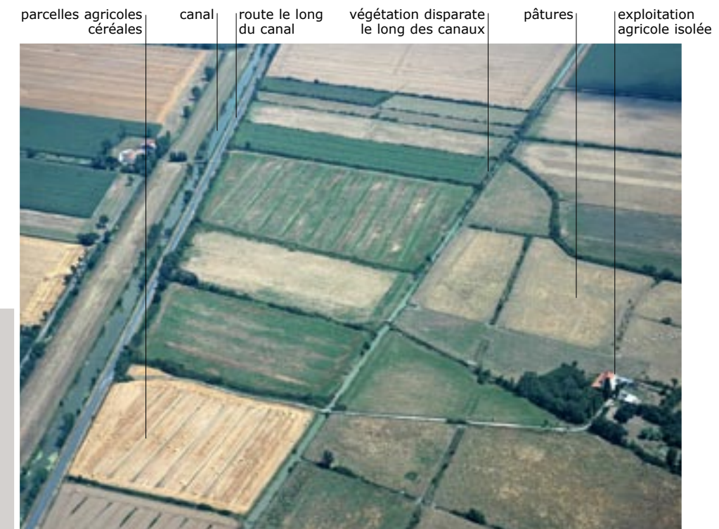
parcelles agricoles céréales canal route le long du canal végétation disparate le long des canaux pâtures exploitation agricole isolée