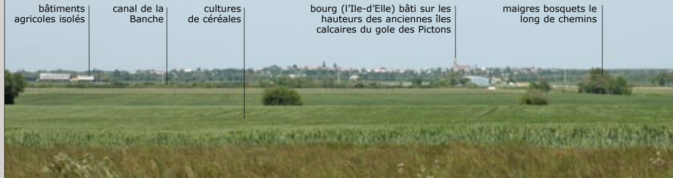
bâtiments agricoles isolés canal de la Banche cultures de céréales bourg (l'Ile-d'Elle) bâti sur les hauteurs des anciennes îles calcaires du golfe des Pictons maigres bosquets le long de chemins