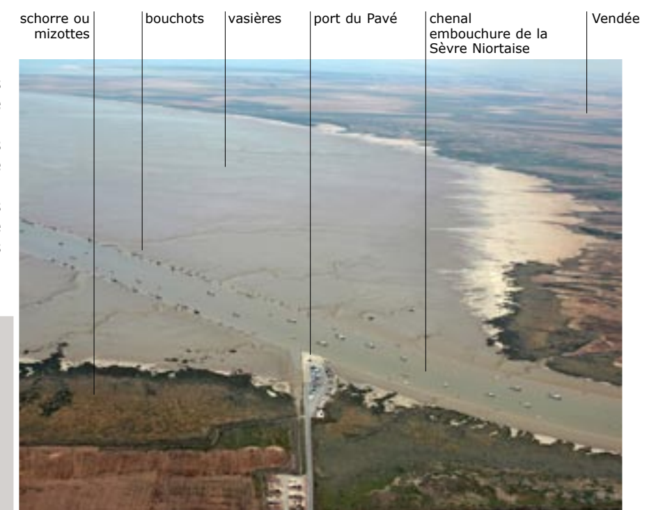
L'anse de l'Aiguillon à l'embouchure de la Sèvre Niortaise

Dans ce climat très lumineux et imprécis, certains éléments apparaissent plus nettement, les bouchots comme une écriture de bâtons, les carrelets comme des dessins au trait, les bateaux comme quelques indications de couleurs vives.