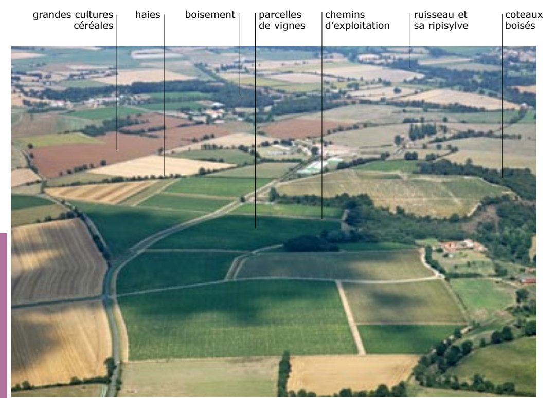
Exploitation viticole au milieu des champs