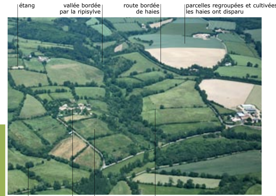
étang vallée bordée par la ripisylve route bordée de haies parcelles regroupées et cultivées les haies ont disparu arbres de hautes tiges ombrage pour le bétail corps de ferme isolé pâtures cernées de haies haies en voie de disparition