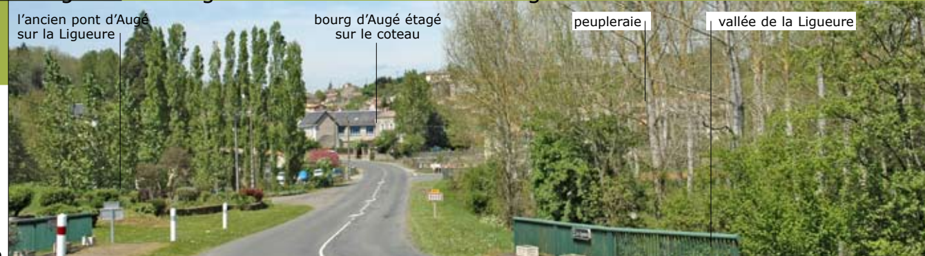
l'ancien pont d'Augé sur la Ligueure, bourg d'Augé étagé sur le coteau, peupleraie, vallée de la Ligueure