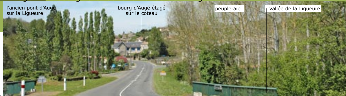
l'ancien pont d'Augé sur la Ligueure bourg d'Augé étagé sur le coteau peupleraie vallée de la Ligueure